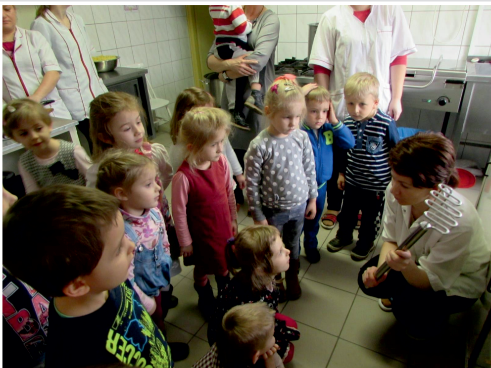
Z wizytą w przedszkolnej kuchni