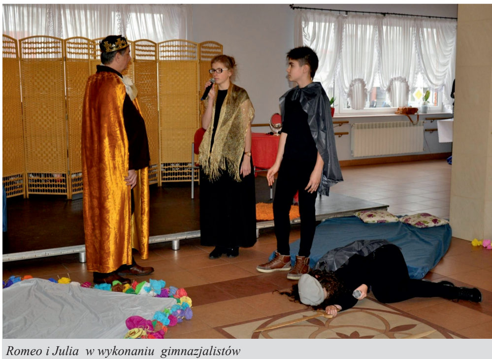
Romeo i Julia w wykonaniu gimnazjalistów

Na zakończenie zebrania nowym członkom stowarzyszenia wręczono legitymacje.