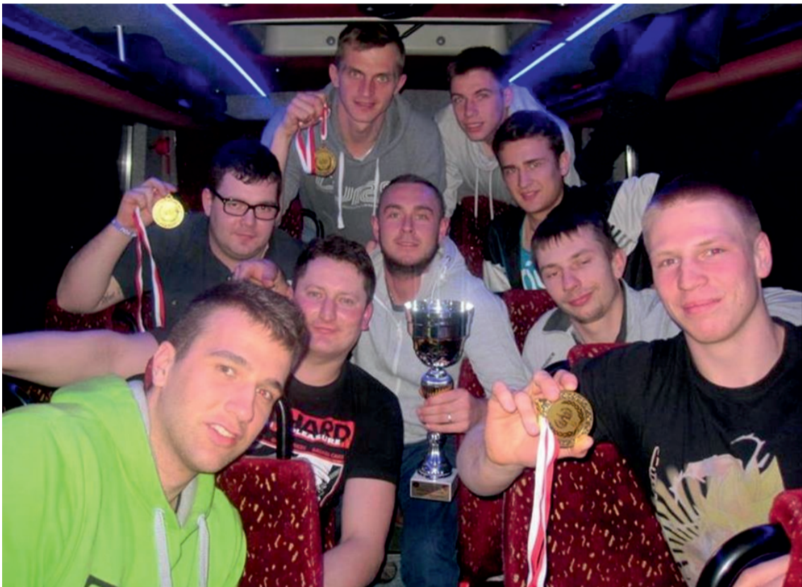
Zawodnicy MKS Malanów

Po raz pierwszy w historii drużyna siatkarska MKS Malanów reprezentująca gminę Malanów wystąpiła w Mistrzostwach Województwa Wielkopolskiego w Piłce Siatkowej. Po zdobyciu mistrzostwa rejonu nadszedł czas na walkę o zwycięstwo w XVII Zimowej Wielkopolskiej Spartakiadzie LZS o Puchar Przewodniczącego Rady Wielkopolskiego Zrzeszenia Ludowych Zespołów Sportowych.