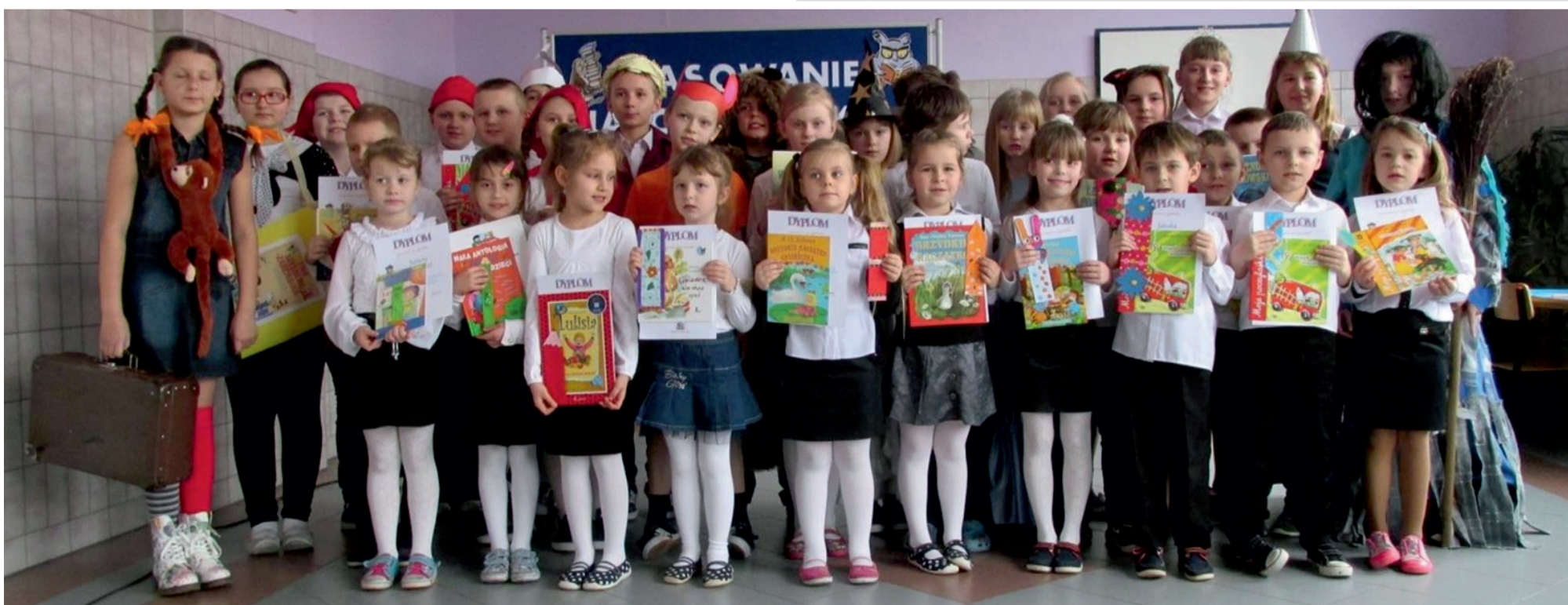
Nowi czytelnicy biblioteki z dumą prezentują dyplomy i książki ufundowane przez Radę Rodziców