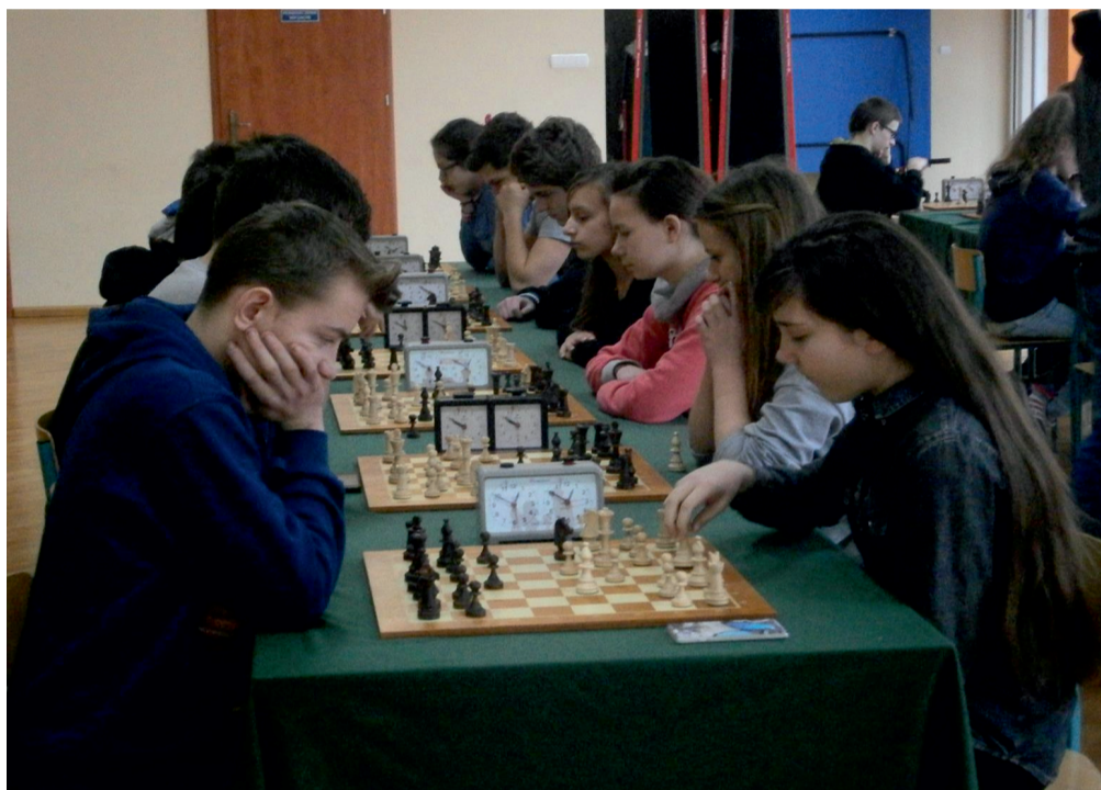
W trakcie ligowych rozgrywek

Gminnego Zespołu Obsługi Oświaty w Malanowie