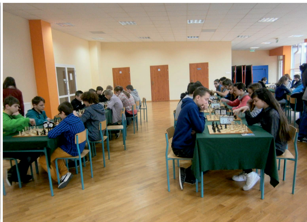
Uczestnicy ligowych rozgrywek