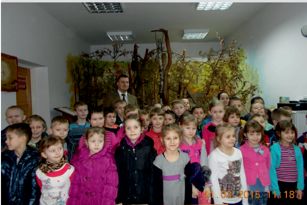
Uczniowie z SP Miłaczew z wizytą w Nadleśnictwie Turek