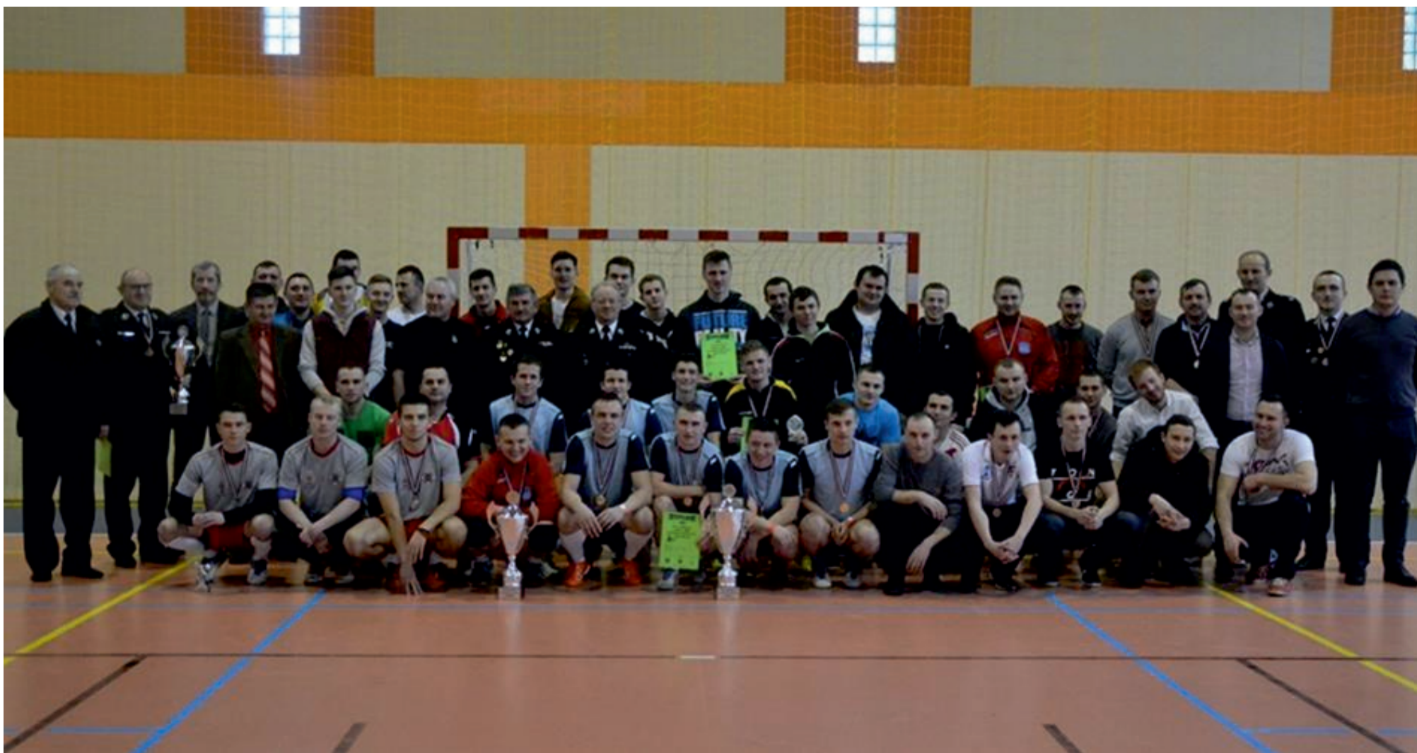
Organizatorzy i uczestnicy turnieju