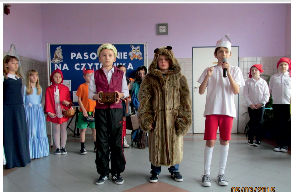
Uczniowie klas IV w przedstawieniu „W krainie bajek”