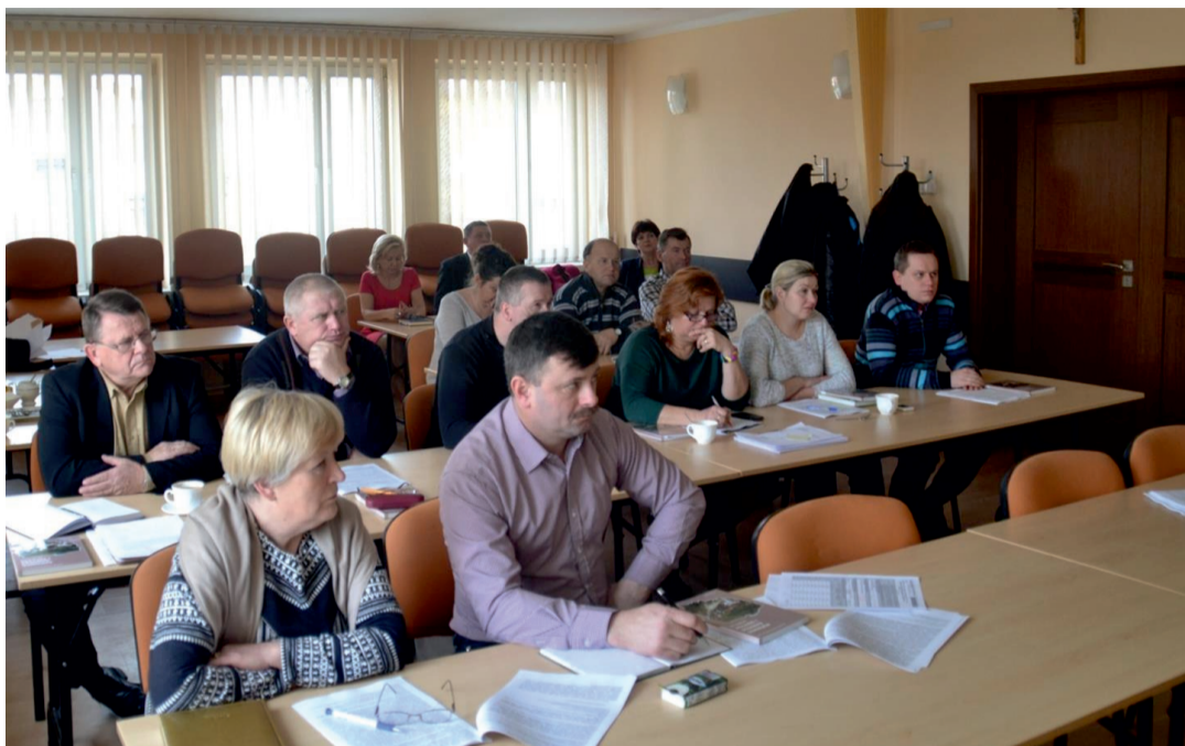
Radni i pracownicy UG podczas szkolenia